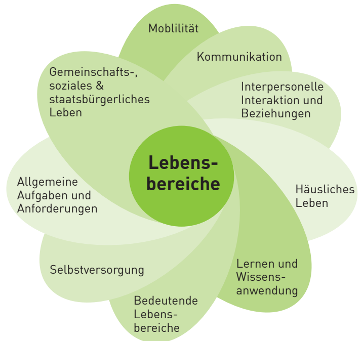
Grafik 2: Neun Lebensbereiche der ICF-Systematik

wurde dem Bedarfsermittlungsinstrument für Erwachsene (BEI_NRW) nachempfunden und an die Bedürfnisse von Kindern und Jugendlichen angepasst. Das Instrument dokumentiert altersgerecht, mögliche Beeinträchtigungen in den oben genannten neun Lebensbereichen.