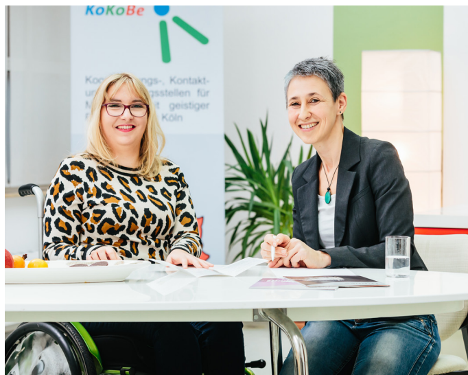
Individuelle Bedarfsermittlung erfolgt im Gespräch mit der leistungsberechtigten Person.

Der Unterstützungsbedarf der einzelnen Person wird dabei in seiner Gesamtheit betrachtet, unabhängig davon, in welchem Lebensbereich Unterstützung benötigt wird.